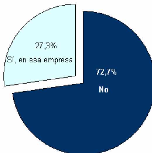
Gráfico 9.2 ¿Conseguiste empleo a través de las prácticas en empresas?

Como en apartados anteriores, y justificado por el hecho de que nuestro informe tiene como objetivo general el análisis del proceso de inserción laboral